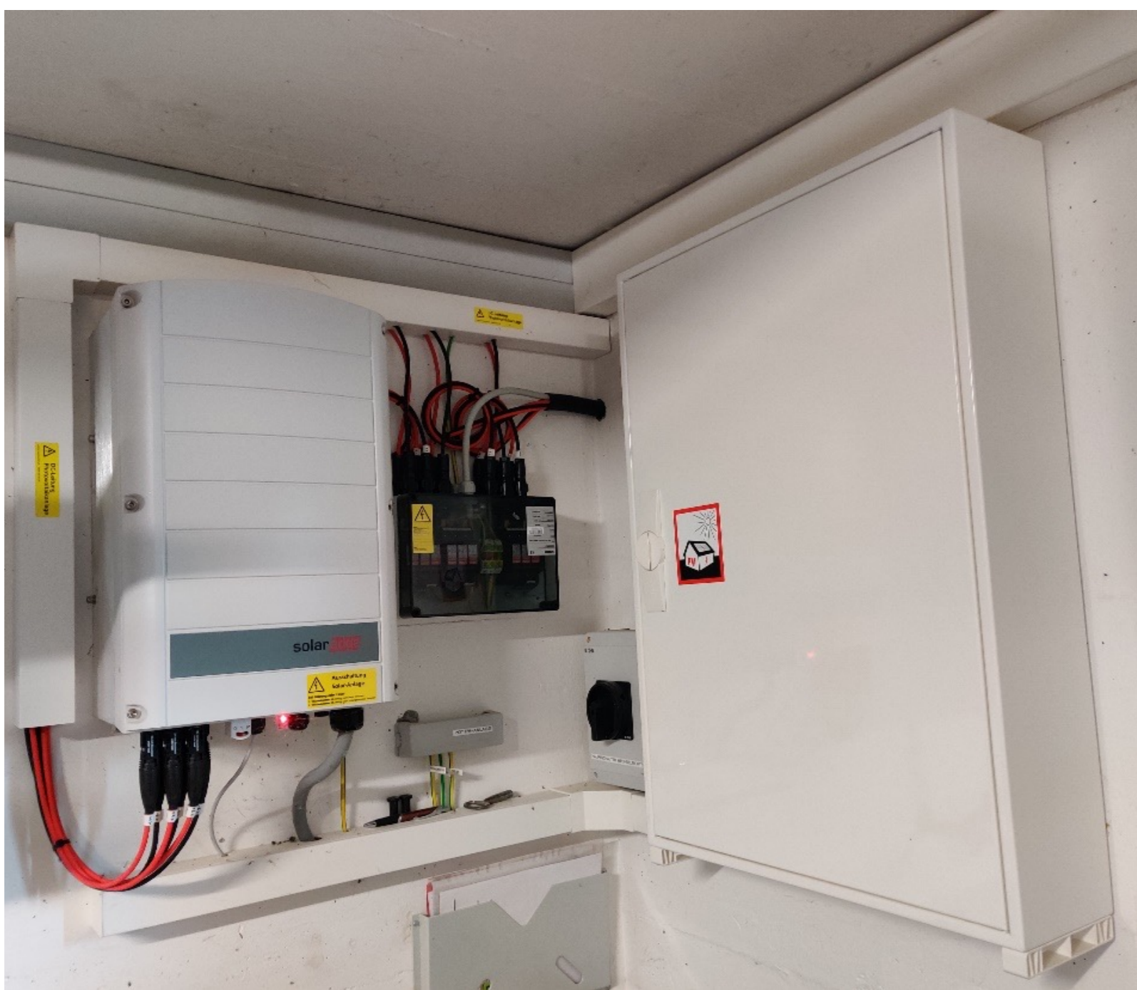
Wechselrichter Solar Edge